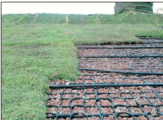
Cubierta vegetal inclinada Sede de la juventud en Leon