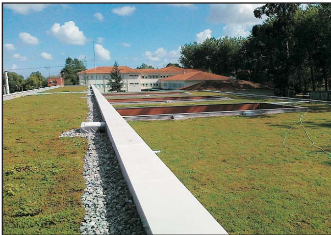
Cubierta vegetal I.E.S. Manuel Gutierrez Aragon en Santander