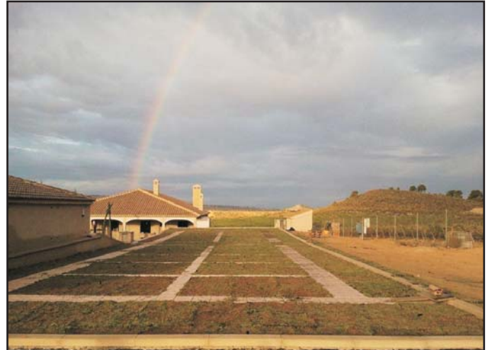
Bodegas "El Nido" Jumilla