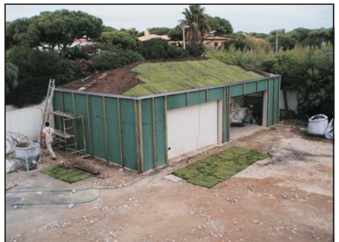
Cubierta vegetal en Garaje particular en Cascais, Portugal