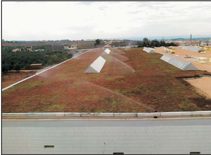
Cubierta vegetal Adegas de Borba, Portugal

Les detallamos algunas de las obras realizadas por nuestros clientes con el producto Top Sedum